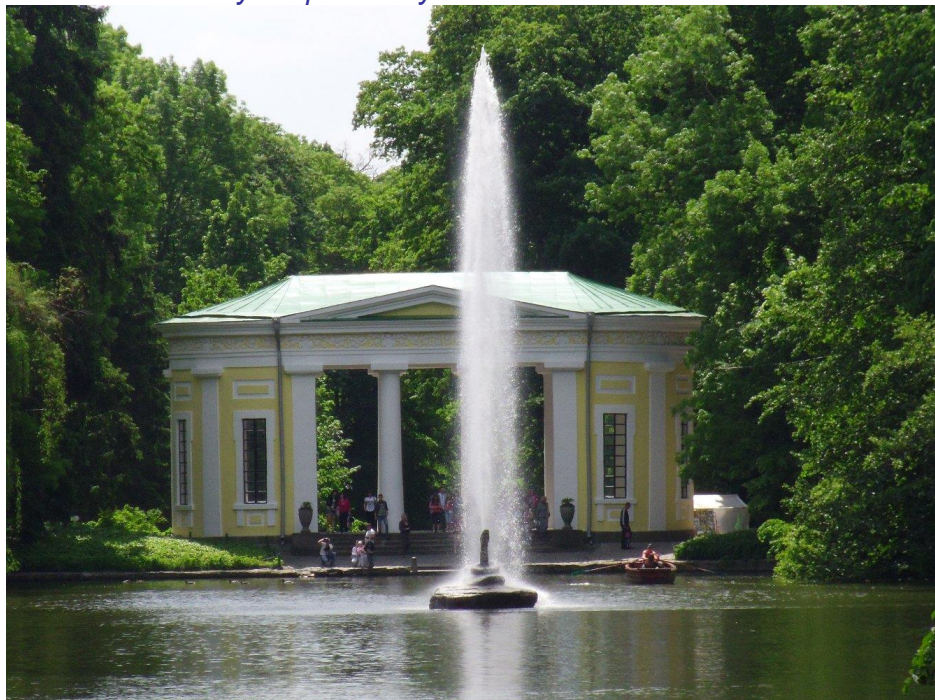
Національний дендрологічний парк «Софіївка»